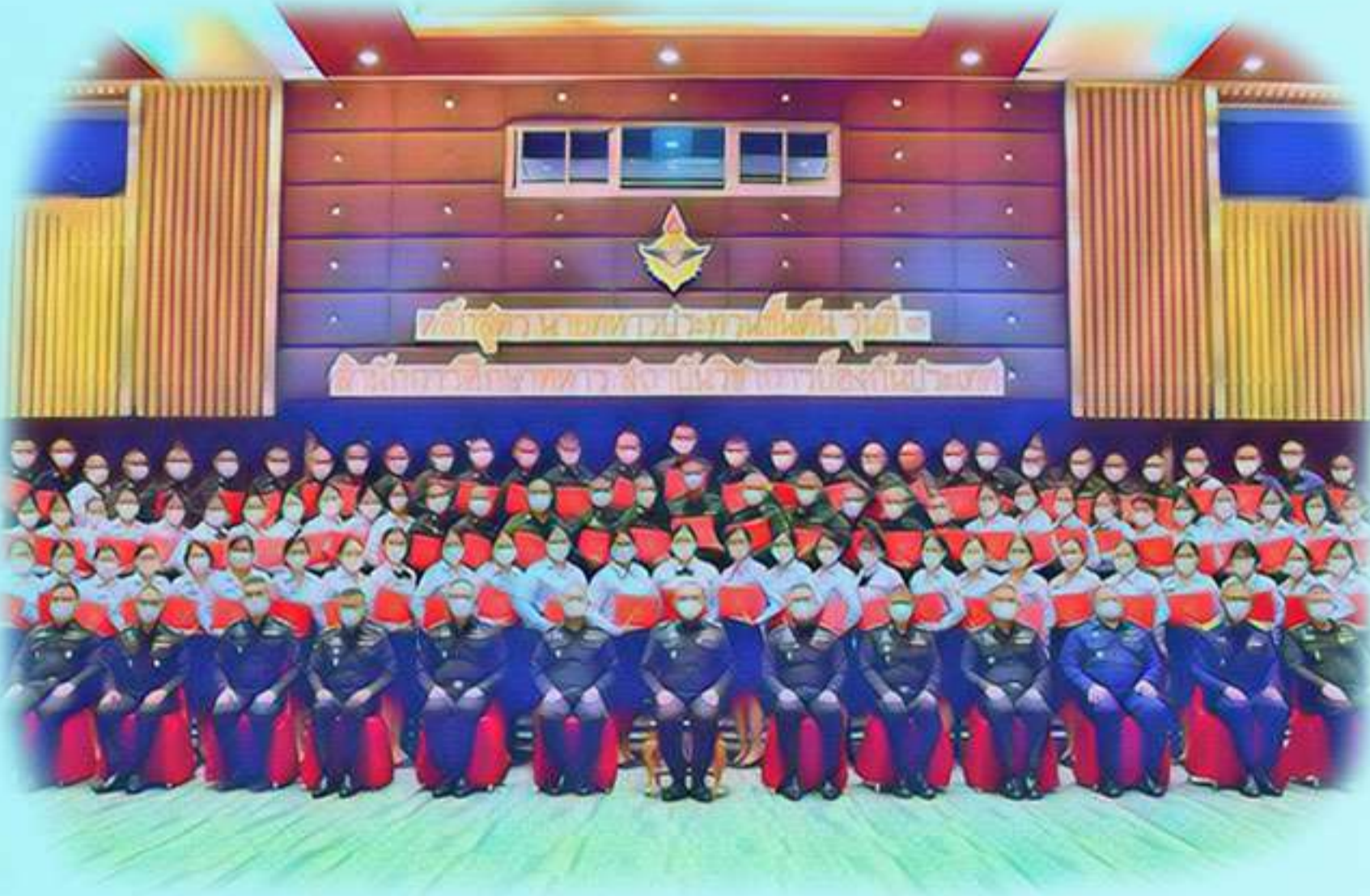
1.1 อบรมหลักสูตรกำลังพลใหม่