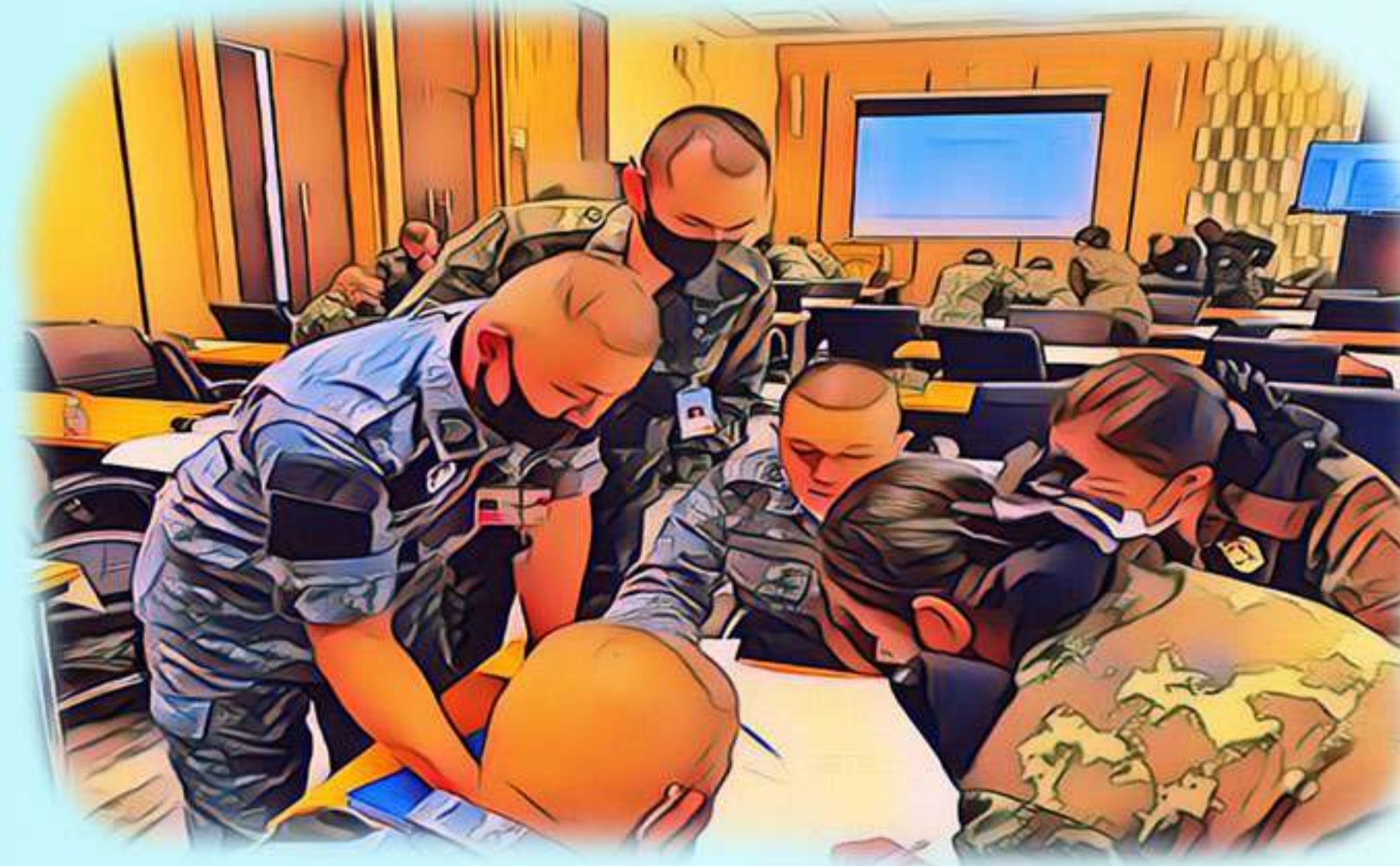
1.2 นายทหารพี่เลี้ยง